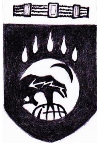
order Godland Östersjöväldet